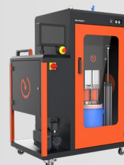
dos feed H

Aufbereiten und Fördern von Materialien bis zu einer Viskosität von 70.000 mPa·s mit einem Füllvolumen bis 60 Liter.